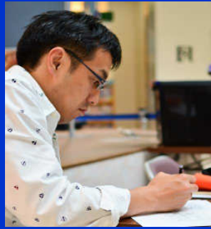
松本 純 (まつもと じゅん)