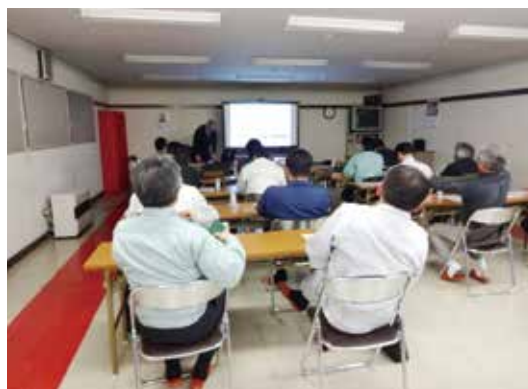
H24 耐震診断・耐震改修補助事業説明会

日頃の計画・設計・監理などの業務の中で、それぞれの地域の特性や様々な災害を考慮した安全で安心な建物やまちづくりに取り組み、合わせて防災訓練や応急支援体制の構築、古い建物の耐震改修などに事前に取り組むことの大切さを改めて感じています。