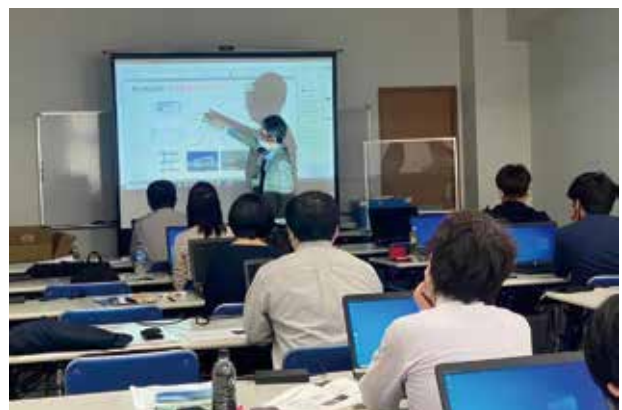
ハンズオンセミナーの様子

ハンズオンセミナーは、導入検討中の方や導入したがほとんど使っていない方に操作・体験して頂く初心者コース、導入したけどなかなか利活用に至らない中級者コースの2コースを主要BIMソフトウェアであるArchicad、Revit、Vector Works、GLOBEの4社の協力を元に5.6.7.8月に実施しました。会場の定員を絞ってはいたしましたが、各回ともほぼ満席のご参加をいただきました。参加できなかった方、申し訳ありません。第二回ハンズオンセミナーの企画も考えていきたいと思っています。CADとは違うBIMの操作感や考え方、BIMの可能性に少しでも触れて頂ければと思います。