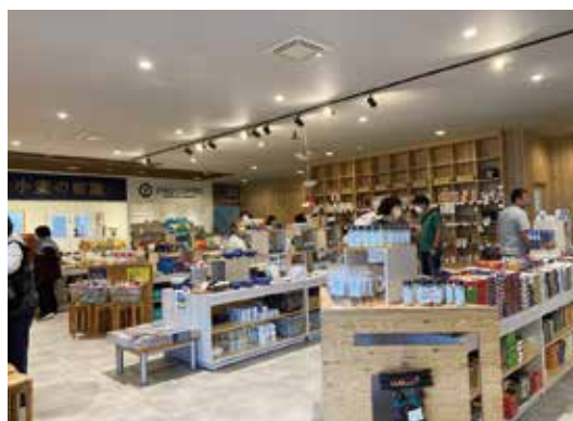
美幌峠道の駅内観