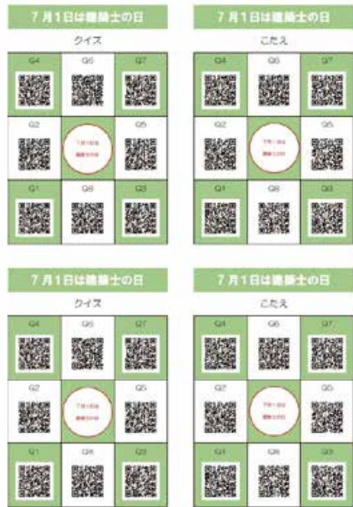
子ども対象の建築クイズ

また、子どもを対象に、もっと建築に興味をもってもらえることはないかと思案した結果、QRコード付きの建築クイズを作成した。興味を持ってもらうきっかけを与えることができた。