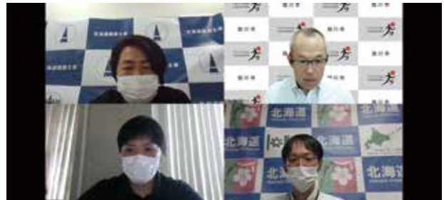
道内自治体職員とのトークセッション

引き続きSeason6の企画準備を進めています。こんなテーマのセミナーをやってほしい。というご要望ありましたらご意見歓迎です。お待ちしております。そして、会場での対面doBIMセミナー（Web同時配信）も今後検討していきたいです。