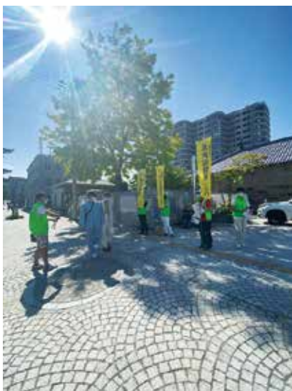
小樽市観光物産プラザ（運河プラザ）前にて

そこで我々青年委員会ができることは、一度、原点に立ち返り、衣食住の「住」に密接に関わる大変重要な仕事である「建築」や「建築士」、そして「ものづくり」をPRできるイベントを周知することを目指した。建築の仕事一般市民に広く知っていただくこと。また、建築士(会)の活動を、一般市民に広く知っていただくためのPR活動を行った。晴天天下の中、不特定多数の一般市民に、北海道建築士会の「ポスター」と「マスク」を130部配布し、周知活動を行った。立ち止まって興味を示してくれる市民も多く、有意義な活動となった。