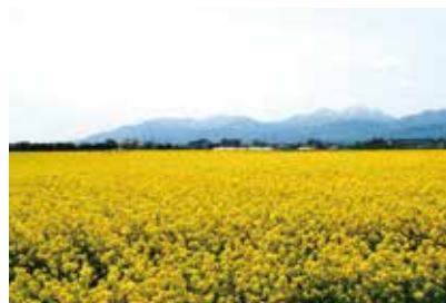
『菜の花まつり』の頃

ほかに滝川市の見所として『菜の花まつり』は風薫る5月の新緑と光輝く水田の田園風景が黄色の絨毯と相まって海外からも含めて数多くの観光客が訪れています。グライダー体験試乗やジンギスカンなどが有名です。ぜひ機会がありましたらお立ち寄りください。