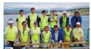
笑顔で優勝賞金10万に挑戦!