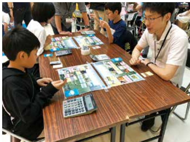
札幌市による出前講座「景カード入門講座」

札幌市の出前講座「景カード入門講座」は、2人対戦型のトレーディングカード（景カード）ゲームを通じて札幌市の景観や都市計画について考えるきっかけをつくるものです。