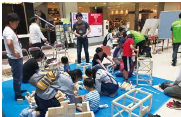
木に触れて組み木を組んでみよう