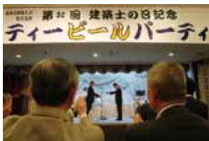
旭山動物園へ寄付金贈呈