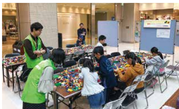
ブロックでまちをつくろう

「ブロックでまちをつくろう」は、本部、旭川支部より用意したレゴブロックで建物などを組み立て、敷地が描かれたシートの上に配置し、まちをつくりあげるものです。