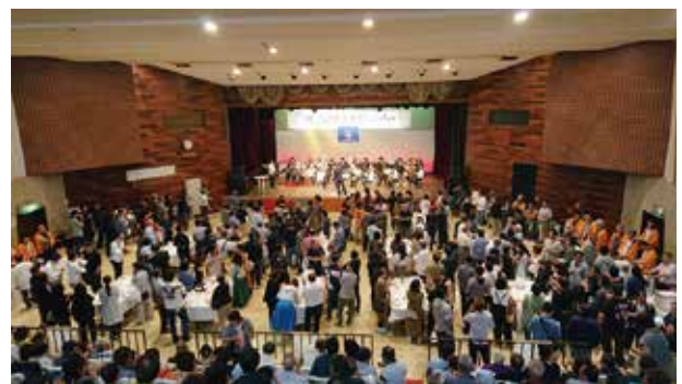
盛況なビールパーティー

7月6日(土)に毎年建築士の日事業として行っている北見支部ビールパーティーを開催しました。当日はあいにくの曇り空でしたが蒸し暑くビールがおいしい日でした。北見はビールパーティー文化がありましてこの時期になると毎週のように開催しています。今年は役員の頑張った甲斐もあり例年より多くのチケット販売があり、当日も900名近いお客さんが来られ吹奏楽団の演奏会や豪華景品が当たる抽選会も行い盛大なビールパーティーとなりました。今回も反省しなければいけない点がありましたが来年は趣向を凝らし盛大な事業になるよう頑張っていきたいと思います。