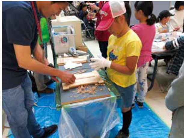
木で遊ぼう！マイはしづくり

今年の新しいイベント「木で遊ぼう！マイはしづくり」は、まず仕上げのデザインを描き、箸をかんなで削り成形後、やすりで仕上げ、塗料を塗布、乾燥することを繰り返し、自分だけの箸をつくるものです。チークはありませんが、自分で作った箸と箸袋がプレゼントされます。