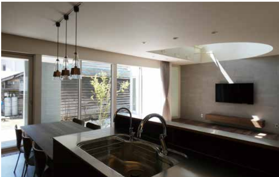
キッチンより中庭を見る