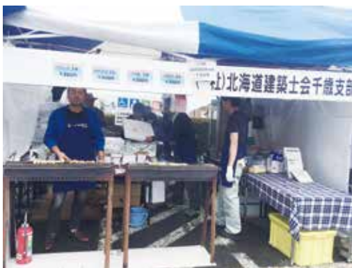
出店した屋台の様子

このイベントへは、来年以降も出店する予定ですので7月の3連休に千歳にお越しの際はぜひ自慢の焼き鳥を食べに来てください。