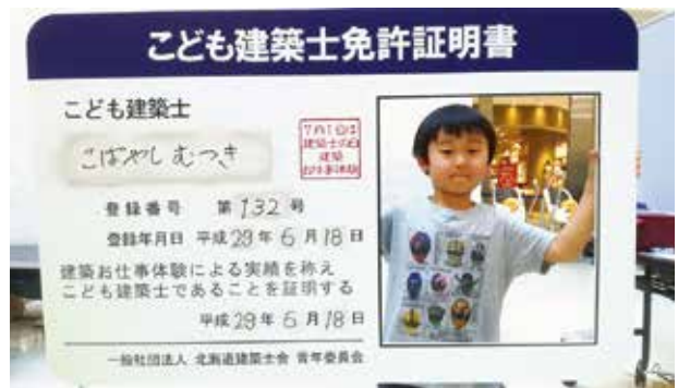
スタンブラリー記念撮影の様子

次に「スタンブラリー記念撮影」についてご紹介いたします。各お仕事体験をすることで、スタンプを貰い、5個集めるとお仕事コンプリート記念としてオリジナル建築士免許証の記念撮影を行い、その場で印刷してプレゼントする企画です。参加してくれた子供たちに、何か思い出として残る物をプレゼントしたいという思いから企画しましたが、子供だ