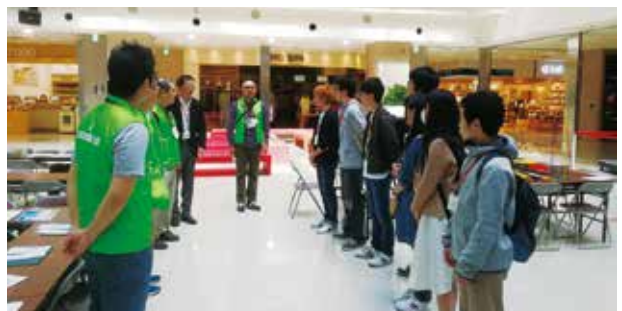
イベント前に互いに挨拶する建築士と学生たち

けではなく保護者の方からも好評をいただきました。北海道職業能力開発大学校から協力してくれた9名の学生は、いずれも将来建築分野での就職を目指しています。学業の合間を縫ってイベントに協力していただき、感謝の一言です。イベント中に時間を作り、先輩建築士から業界についてのアドバイスや意見交換が出来たことも有意義でした。こういった関係を今後も大事にしていきたいと思っています。