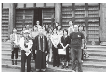
最創山光岸寺前での集合写真

すると様々な仕掛けがあり、探検をしているようで、先生とのダブル解説はとても楽しいものでした。