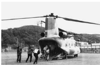
ヘリコプターで避難する参加者 =中島スポレク広場

私は、ワゴン車で避難しましたが、渋滞等はなくスムーズに移動できました。各町村は、小樽、札幌方面へと避難しましたが、現実となったら風向き次第では何処へ避難したら良いのか分かりません。