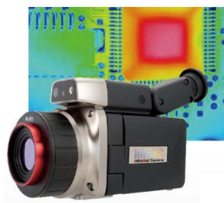
超解像処理による120万画素高分解能サーモカメラ