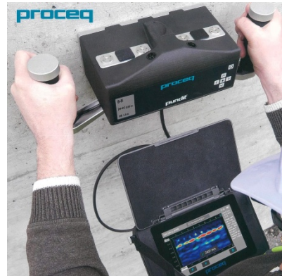
超音波イメージスキャナ バンジット 250 アレイ