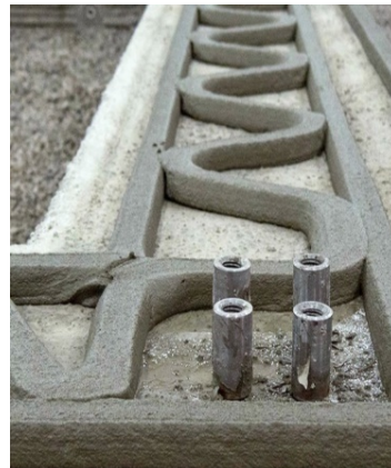
大型コンクリート 3Dプリンタ