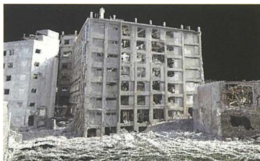
3Dレーザースキャナの例