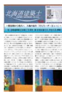
全道大会（空知大会）の様子