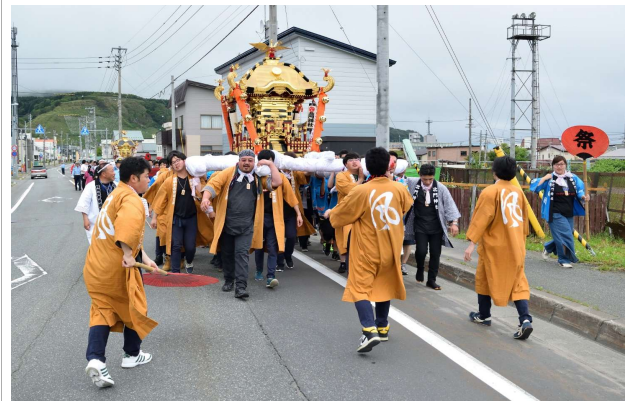
写真② 神輿渡御の様子