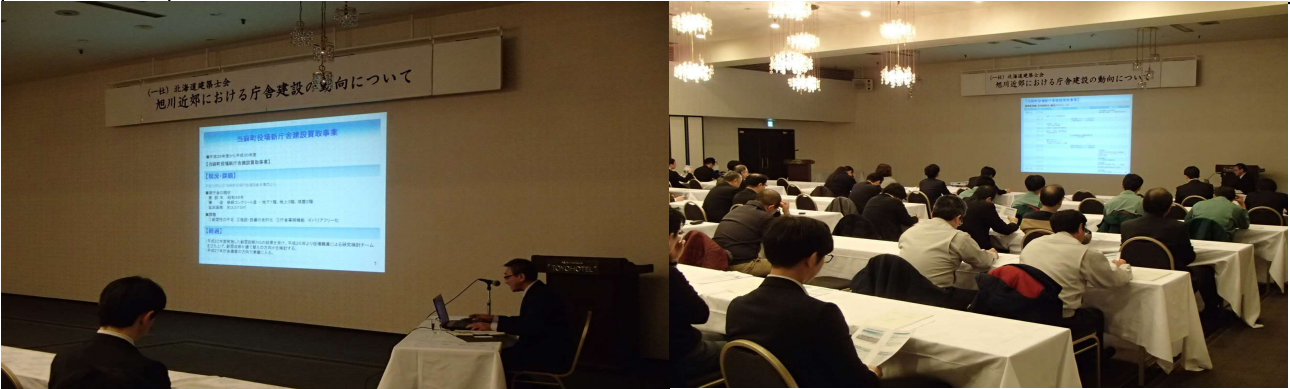
イベントの様子 会場全体