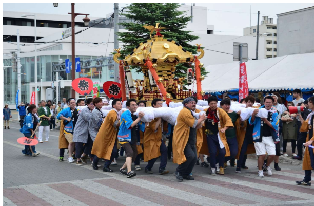
写真① 神輿渡御の様子