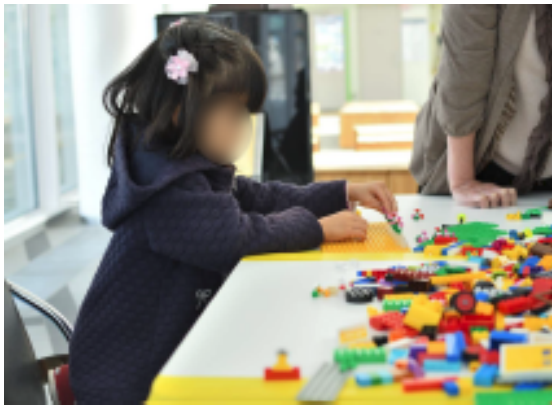
写真① イベントの様子