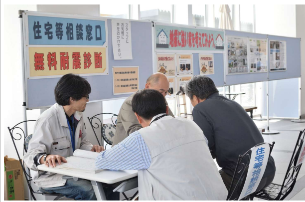
写真② 稚内市住宅相談の様子

●今後の課題 開催日が市内の小学校の学芸会と重なり子供たちの参加が少ない、運営する会員の人数が足りないなどがありました。開催日時の検討が必要でした。