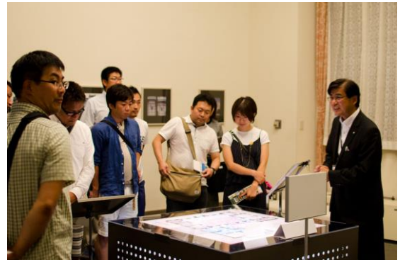
【施設職員による説明】

続いて2016年7月にオープンしたばかりのニトリ小樽芸術村を見学してきました。こちらも古い倉庫や事務所を小規模な美術館として再活用しています。