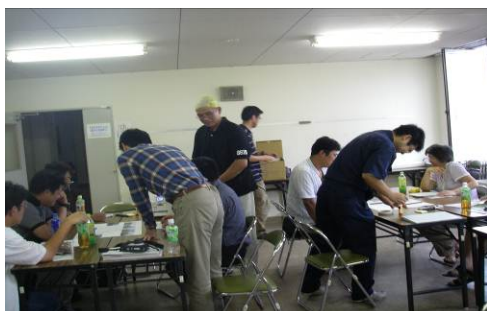
写真選定・コメント作成