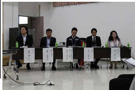
パネルディスカッション