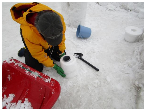
★スノーキャンドルはポリバケツが型枠です