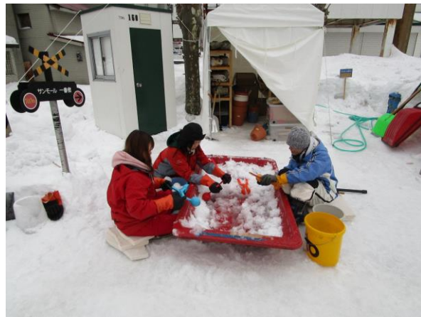
★韓国の若者ボランティアに雪玉作りの指導中