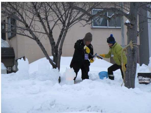
★午後4時半頃 オブジェやキャンドルにひとつひとつ手で火を灯してゆきます