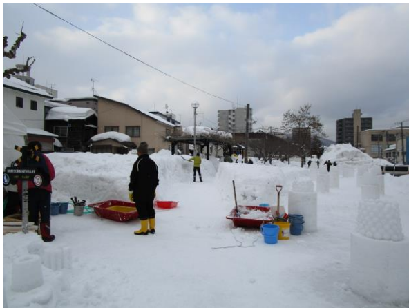
★パールキャンドルは雪玉を重ねて作ります