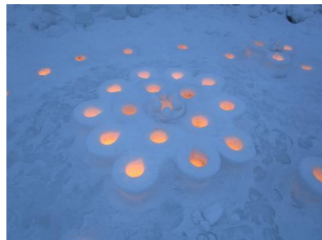
★午後5時、花火の合図とともに開幕