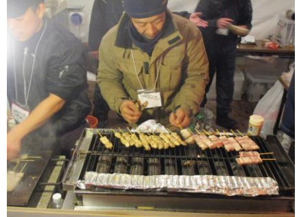
★焼き鳥は外国観光客にも大人気