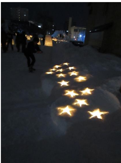
★旧手宮線会場 地上の星