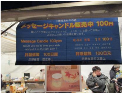
★メッセージキャンドルも販売