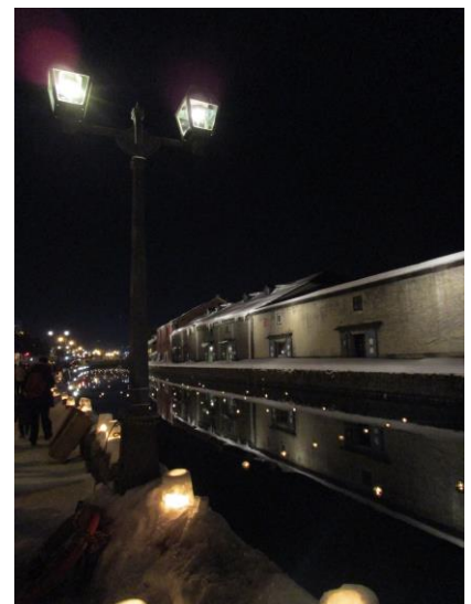
★小樽運河会場 浮き球キャンドル