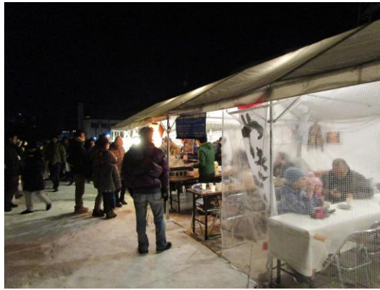
★無料休憩処は全10日間解放、たくさんの方にご利用いただきました