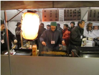
★定番メニューの焼きそば