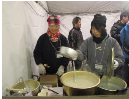
★甘酒は女性委員会担当