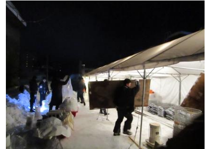
★最終日は全員で解体作業。(お手のもの！)