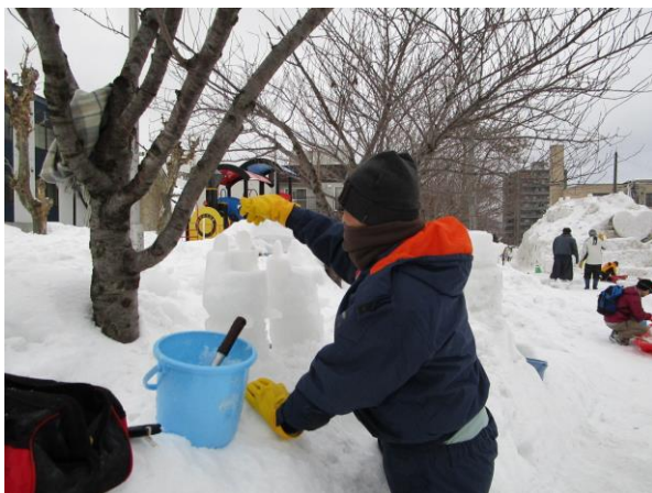
★大人気のフクロウのオブジェ、完成間近