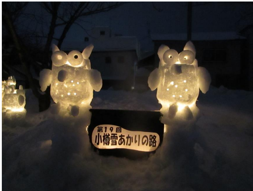
★フクロウの森 フクロウは建築士会会員のオリジナル作品